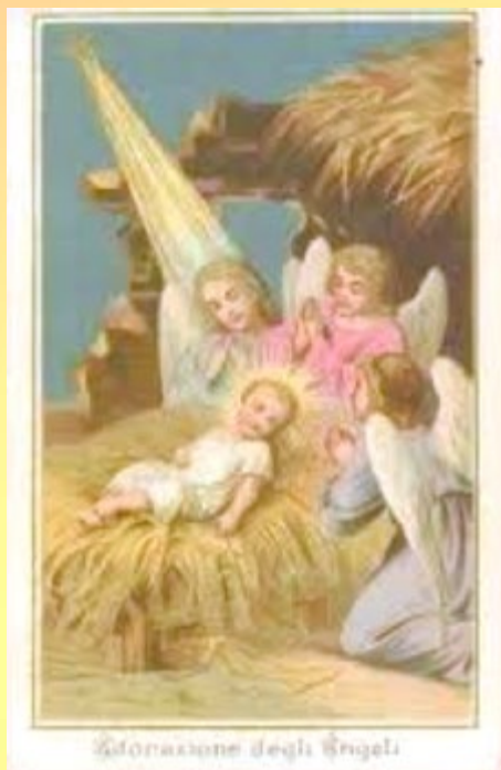
Adorazione degli Angeli